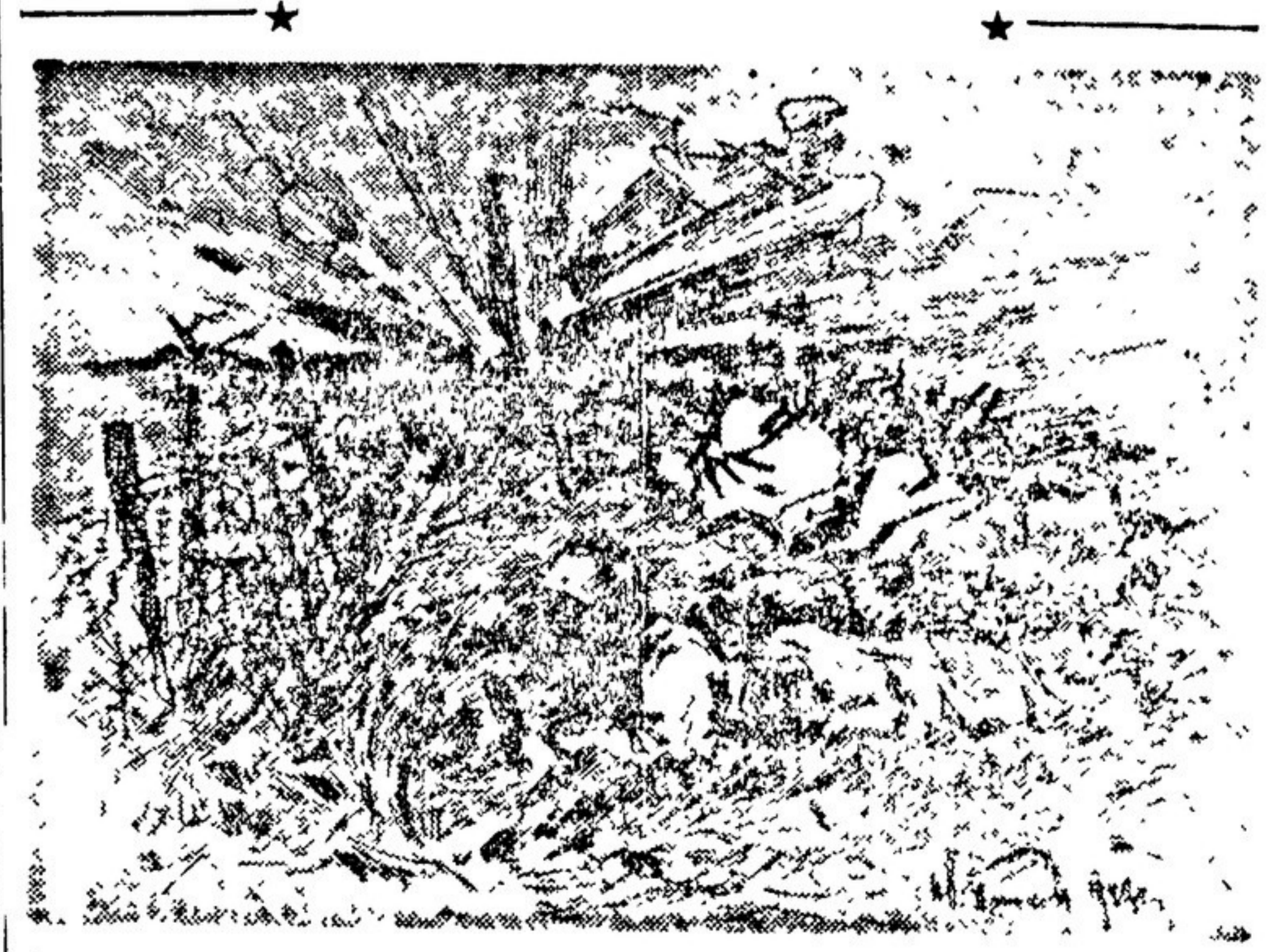
Сперсы делают проходы в немецких проводочных заграждениях. Рисунок художника-фронтовика К. ТИТОВА.

Чуть, слышала земля Звезды из Кремля. В этом громе каждый раз Слышались: — Донбасс!