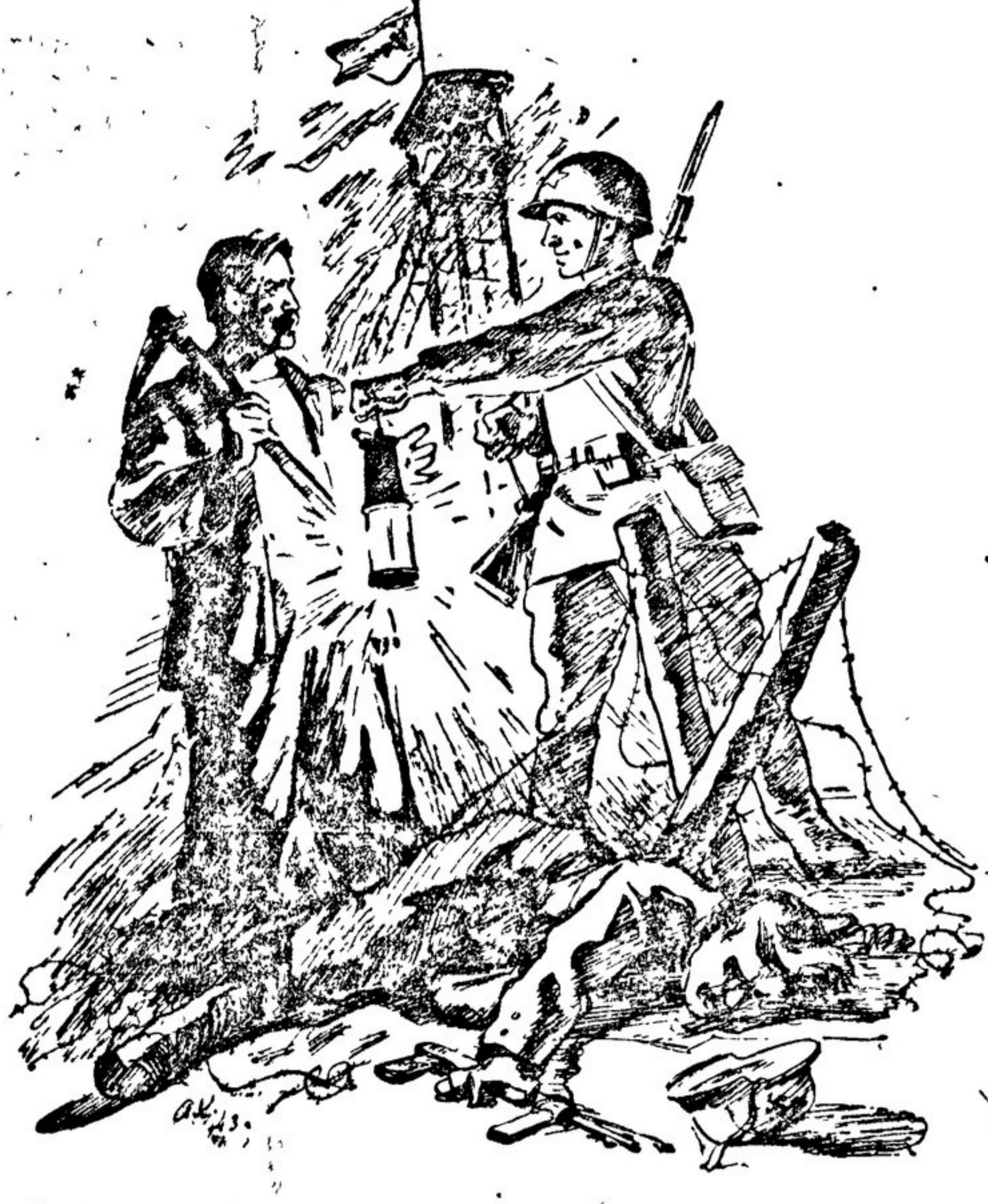
«Донбасс освобожден» Рисунок А. КОЛОДЯКИНА.

КРАСНОДАР Краевой драматический театр работает в районах В Краснодаре он откроет сезон 1 декабря. К этому времени закончится ремонт крупнейшего в городе кино «Колос», в помещении которого будет выступать драматическая труппа.