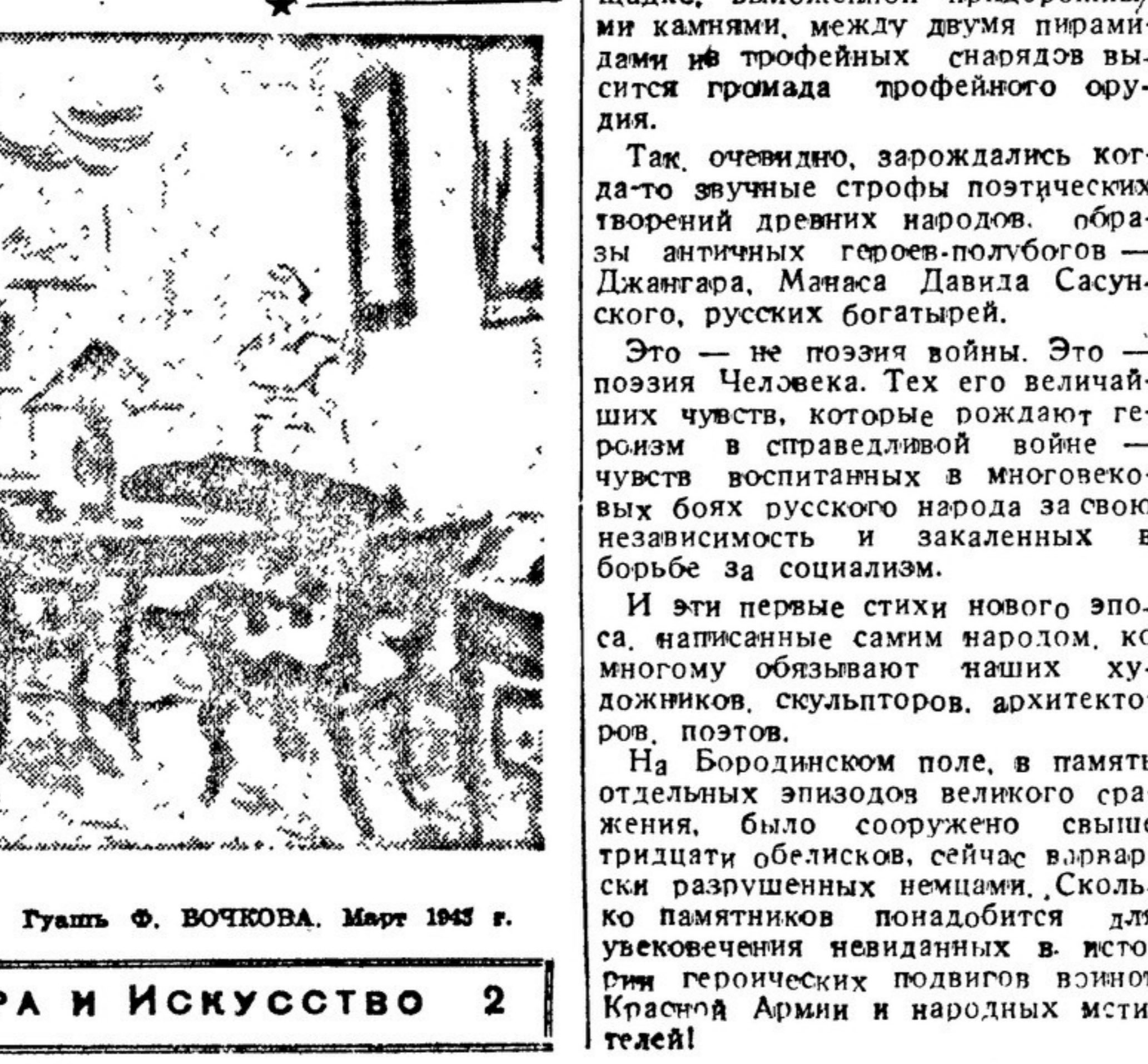
«Комната в Ясной Полине». Гравюра Ф. ВОЙЧКОВА. Март 1945 г.